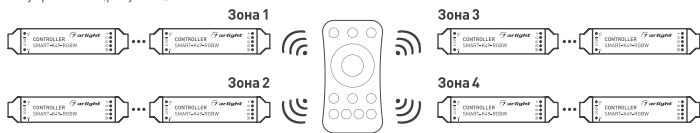
Рисунок 3. Вариант построения системы с 4-зонным пультом дистанционного управления